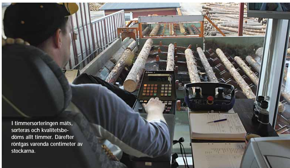
I timmersorteringen mäts, sorteras och kvalitetsbedöms allt timmer. Därefter röntgas varenda centimeter av stockarna.