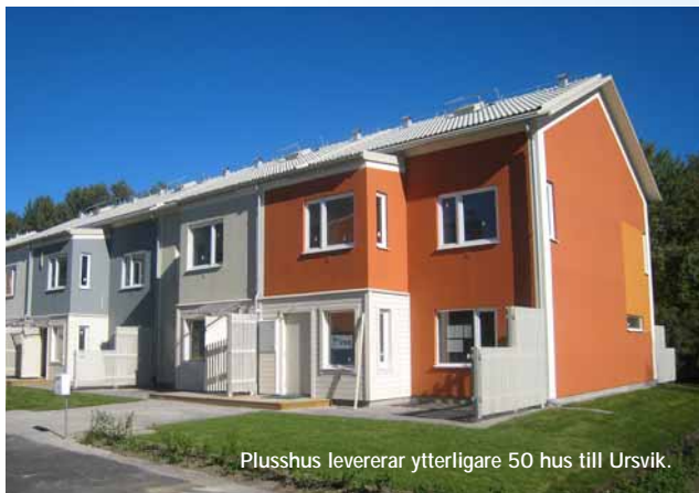
Plusshus levererar ytterligare 50 hus till Ursvik.