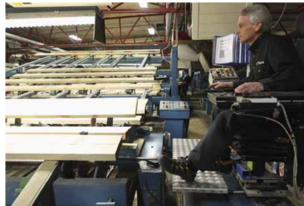
Det nuvarande justerverket kommer snart att bytas ut mot ett nytt, kamerastyrt. En investering på 60 miljoner kronor.