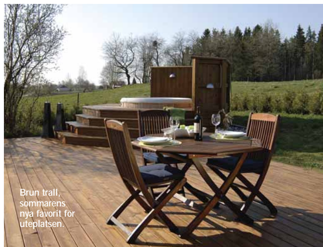
Brun trall, sommarens nya favorit för uteplatsen.

Den stora fördelen med ett vertikalexlat vindkraftverk är framför allt att det är billigare att driva och har en tystare gång. Detta tack vare att tekniken finns på marknivå.