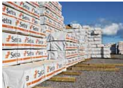
Under de kommande månaderna ska 60 procent av årets produktion levereras ut.