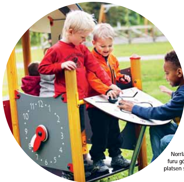
Norrländsk furu gör lekplatsen säker.