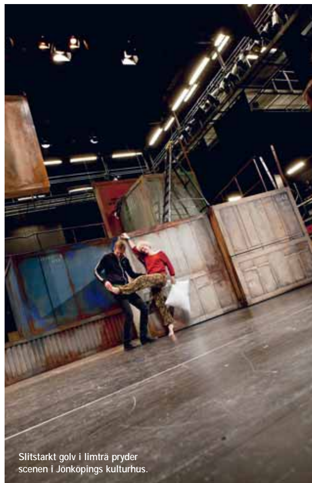
Slitstarkt golv i limträ pryder scenen i Jönköpings kulturhus.